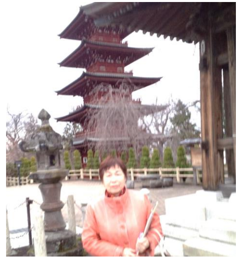
新寺町で戦争法廃止の署名活動

の報告があった。県としては何よりも安全の確保が第一であり、施設の安全性について県民の理解が得られるよう一層の取り組みをお願いした」と答