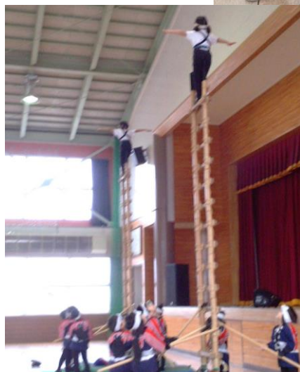
藤代地域文化祭にはじめて招待されました。保育園児のはしご乗りにはびっくりポン!