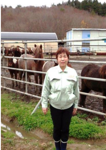
中泊の建設会社経営の馬飼育場の環境整備を求めて県西北県民局畜産課や中泊町役場農政課の方々と調査をしました。