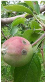
りんご黒星病調査