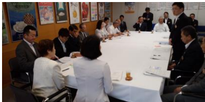
りんご黒星病対策県に申し入れ