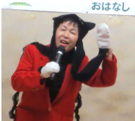
サプライズで歌って踊った クロネコのタンゴ