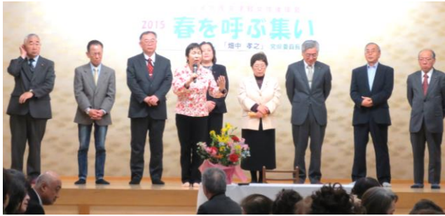
津軽地区議員団挨拶