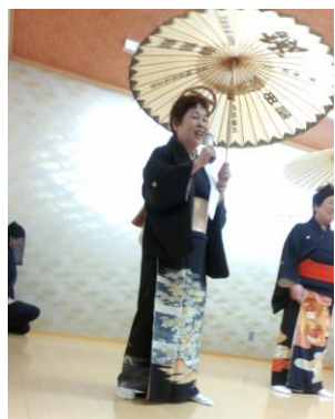
3月13日 日本共産党津軽女性後援会主催「早春のつどい」で女性議員による白波4人衆を披露

★他、国の方針が変わった安定ヨウ素剤の事前配布範囲、避難計画の際のスピーディー使用について県の考え方を質しました。